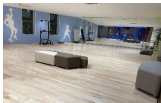
アクティビティスペース