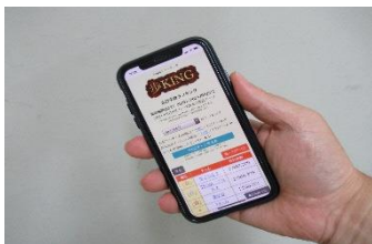
アプリを使ったウォーキングイベント